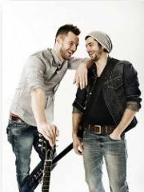
PizzeraJaus_color_01 1