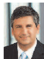
Dr. Michael Spindelegger Bundesminister für euro- päische und internationale Angelegenheiten