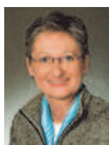
Dr. Claudia Schmied Bundesministerin für Unterricht, Kunst und Kultur