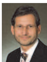
Dr. Johannes Hahn Bundesminister für Wissenschaft und Forschung