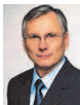
Alois Stöger Bundesminister für Gesundheit