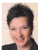
Gabriele Heinisch-Hosek Bundesministerin für Frauenangelegenheiten und Öffentlichen Dienst

Bei der Zusammensetzung der Bundesregierung gibt es verschiedene Formen: