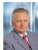
Rudolf Hundstorfer Bundesminister für Arbeit, Soziales und Konsumentenschutz