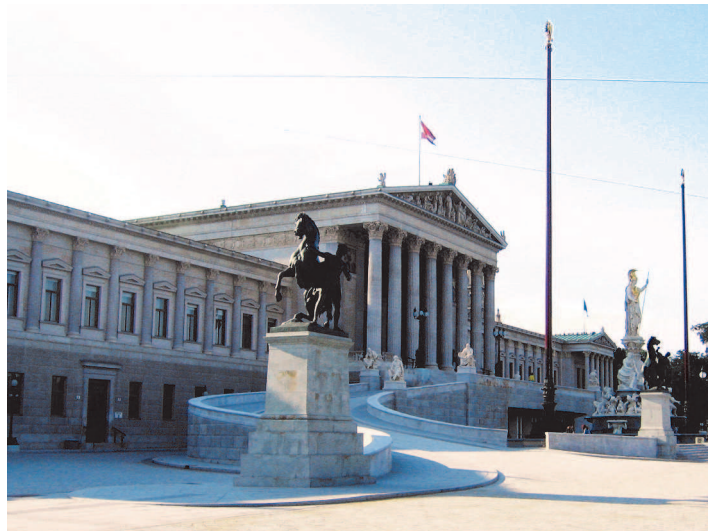
Parlamentsgebäude in Wien

Der Nationalrat ist für den Antrag, die Beratung und den Beschluss von Bundesgesetzen , der Genehmigung des Bundesbudgets (= Bundesfinanzgesetz) und der Kontrolle der Bundesregierung zuständig. Der Nationalrat setzt sich aus 183 Abgeordneten zusammen, die vom Bundesvolk für eine Gesetzgebungsperiode von fünf Jahren gewählt werden.