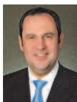
Dipl.-Ing. Josef Pröll Vizekanzler und Bundes- minister für Finanzen