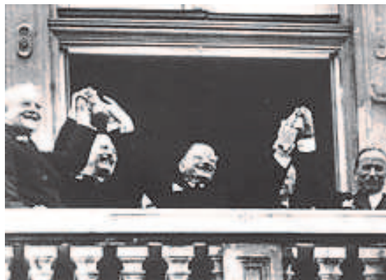
Außenminister auf dem Balkon des Schlosses Belvedere

Am 15. Mai 1955 erfolgte die Unterzeichnung des Staatsvertrages im Wiener Schloss Belvedere mit den Außenministern der vier Alliierten und dem österreichischen Außenminister Figl.