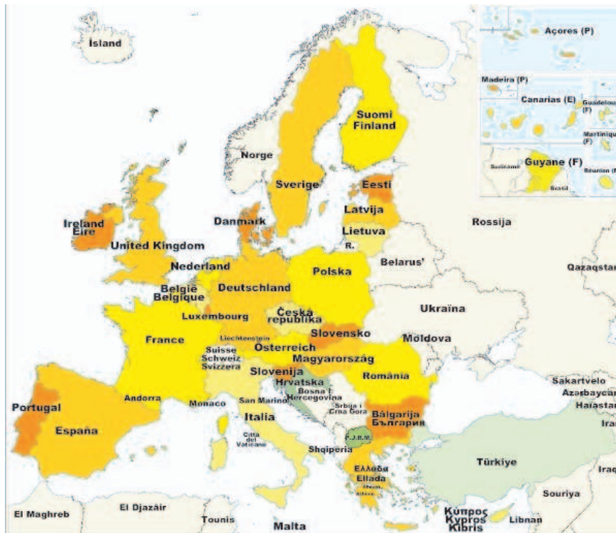
Mitgliedstaaten der Europäischen Union