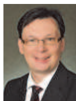
Mag. Norbert Darabos Bundesminister für Landesverteidigung und Sport