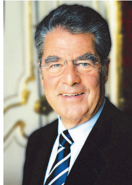
Dr. Heinz Fischer

Das Staatsoberhaupt in Österreich ist der Bundespräsident. Er wird direkt von den Staatsbürgern auf sechs Jahre (Amtsperiode) gewählt. Der derzeitige Bundespräsident heißt Dr. Heinz Fischer.