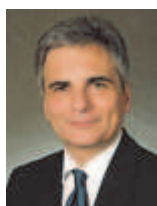
Werner Faymann Bundeskanzler