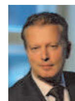
Dr. Reinhold Mitterlehner Bundesminister für Wirtschaft, Familie und Jugend