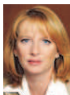
Doris Bures Bundesministerin für Verkehr, Innovation und Technologie