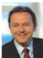
Dipl.-Ing. Nikolaus Berlakovich Bundesminister für Land- und Forstwirtschaft, Umwelt und Wasserwirtschaft