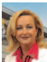
Dr. Maria Fekter Bundesministerin für Inneres