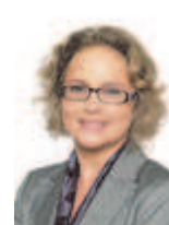
Mag. Claudia Bandion-Ortner Bundesministerin für Justiz